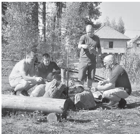
Draudzes vīru sarunas pie ugunsкура Tēva dienā.

Otrajā septembra svētdienā Latvijā jau astoto gadu svinējām Tēva dienu. Pirmo reizi pasaulē Tēva diena tika atzīmēta 1910. gadā Amerikas Savienotajās Valstīs. Gadsimta laikā šie svētki iemantojuši nozīmīgu vietu – tos svin 135 valstīs. Dažādās zemēs svētku datums atšķiras. Lielā daļā valstu, kurās dominē katoļticība, Tēva dienu svin 19. martā. Tas tāpēc, ka šai datumā kristīgā baznīca atzīmē Svētā Jāzepa dienu. Tiek pieminēts Jēzus Kristus audzītēvs un Vissvētākās Jaunavas Marijas ligavainis – cilvēks, kuram vienam no pirmajiem bija gods savām acīm skatīt Dieva Dēlu.