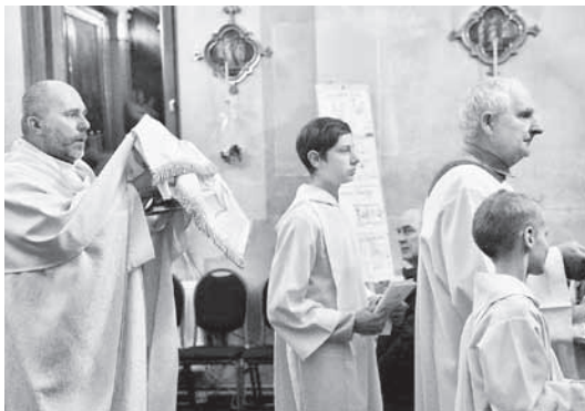
Sv. Mise Madonas katoļu baznīcā.

Mūsu izdevumā savukārt nedaudz pakavēsimies pie ministrantu ārējā ietērpā. Piekalpotāju liturģisko apģērbu liturģisko funkciju veikšanai sauc par komžu. Komža ir baltas krāsas tērps, kas simbolizē dvēseles tīrību un sirds-skaidrību. Komža sniedzas līdz ceļiem, taču var būt arī garāka. Komžai raksturīgas platas piedurknes. Kakla izgriezums ir ovāls, retāk