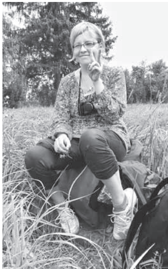
Raksta autore šīs vasaras ceļā uz Aglonu.