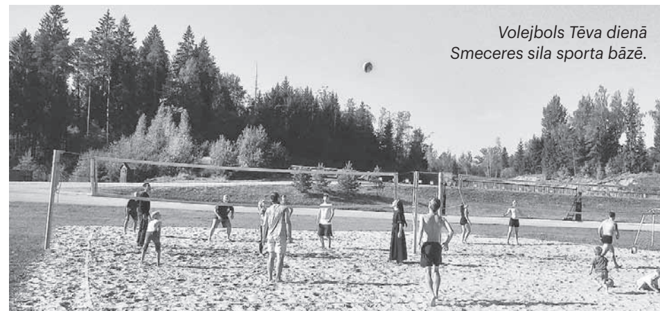
Volejbols Tēva dienā Smecerēs sila sporta bāzē.

Ģimenes tēvs stāsta: – Ikdienā bērni ar mani nerunā, draugu klātbūtnē tēlo, ka nepazīst, bet, kad notiek lielas nepatīkšanas, tad gan ātri skrien pie manis.