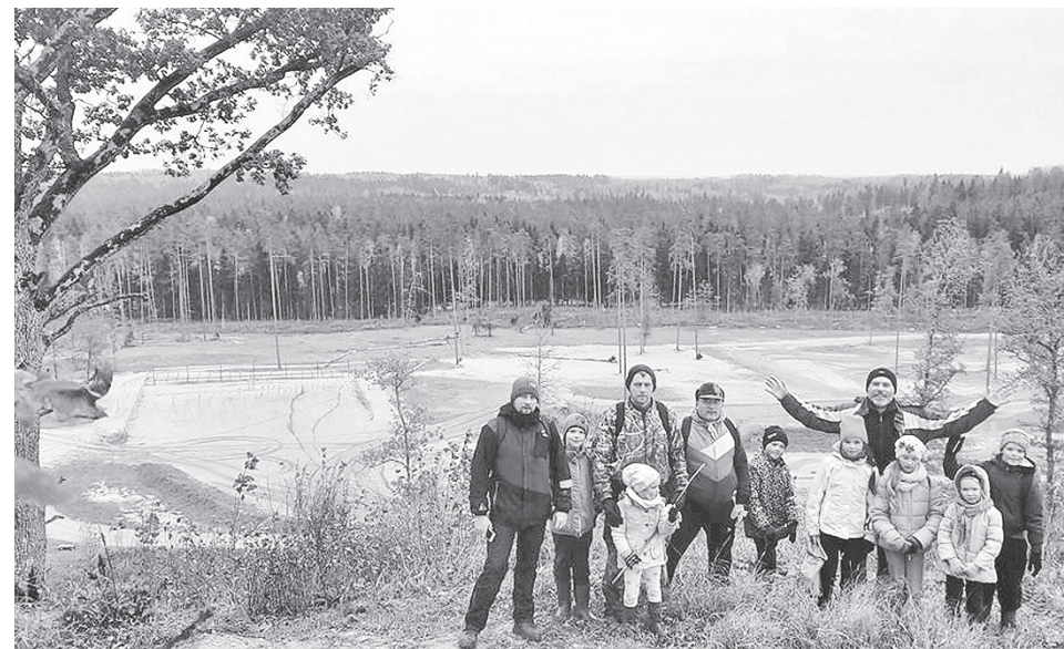
Pārgājiena dalībnieki apliecināja izturību un savstarpēju sadraudzību.