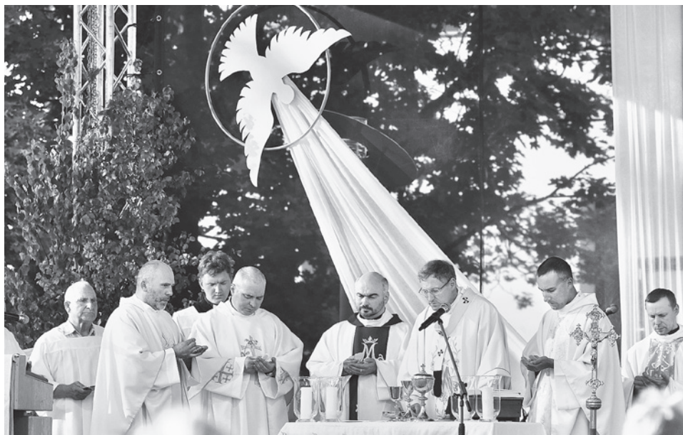
Mirklis no Svētās Mises, kas veltīta svētgleznas „Vissvētākā Jaunava Marija – Kristīgo palīdzība” kronēšanai. Madona, 2016. gada 2. jūnijs.

Bija iespēja doties uz Rīgas Kristus Karaļa baznīcu, kur notika vairāki harizmātiskās slavēšanas brīži. Patiess prieks, pielūgsmē, slavēšana, izlīgšana un vienotība ar Dievu un līdzcilvēkiem raksturoja šos pa-