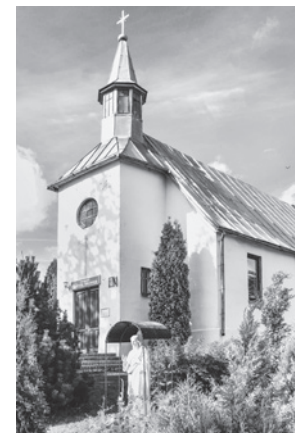
Madonas katoļu baznīca.