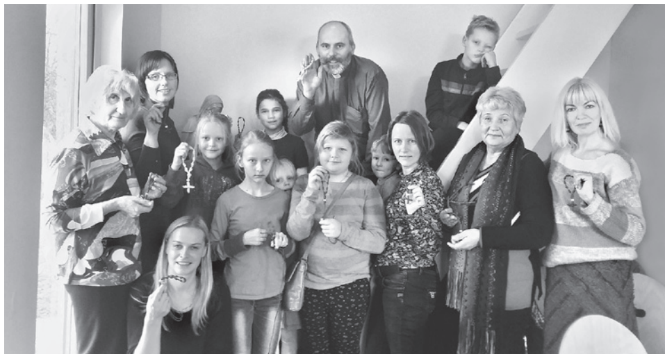
Pēc darba ikviens ir gandarīts par pašdarināto lūgšanu rīku.